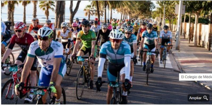
El Colegio de Médicos de Cuenca participará en el XIII Campeonato de España de Ciclismo para Médicos