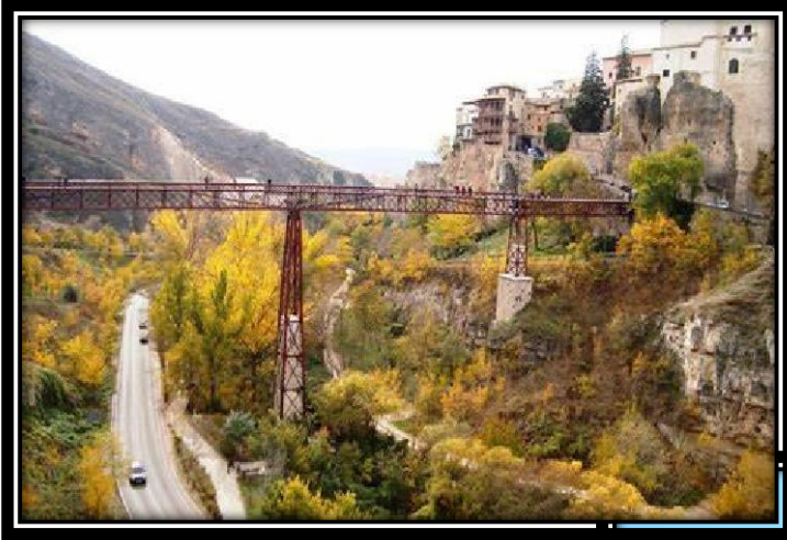
Zona de Meta. Carretera Palomera (CUV 9144) debajo del Puente de San Pablo