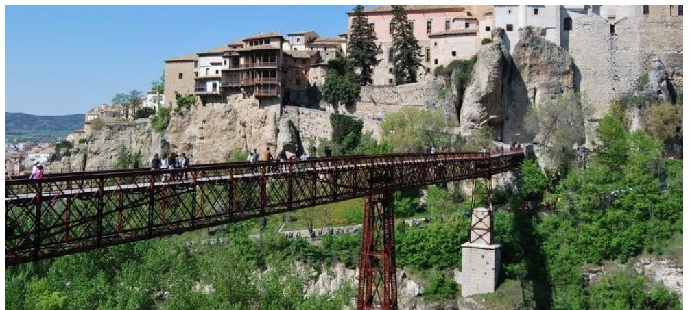
Casas Colgadas y Puente de San Pablo