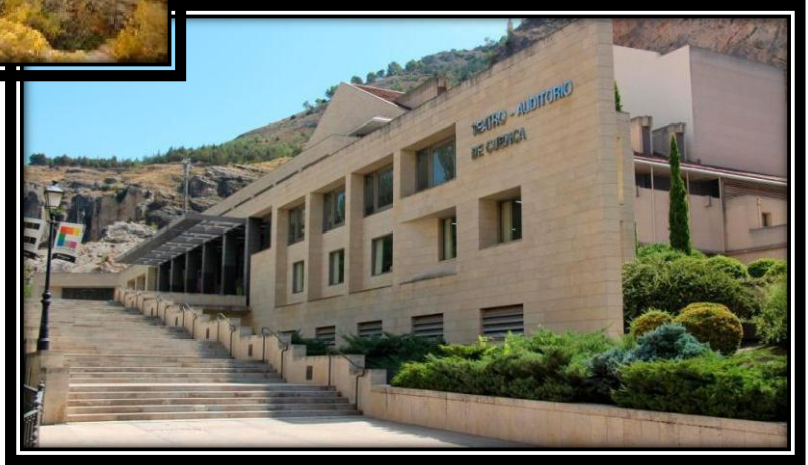
Teatro Auditorio Jose Luis Perales. Entrega de Premios